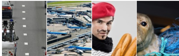
Belg slecht voorbereid